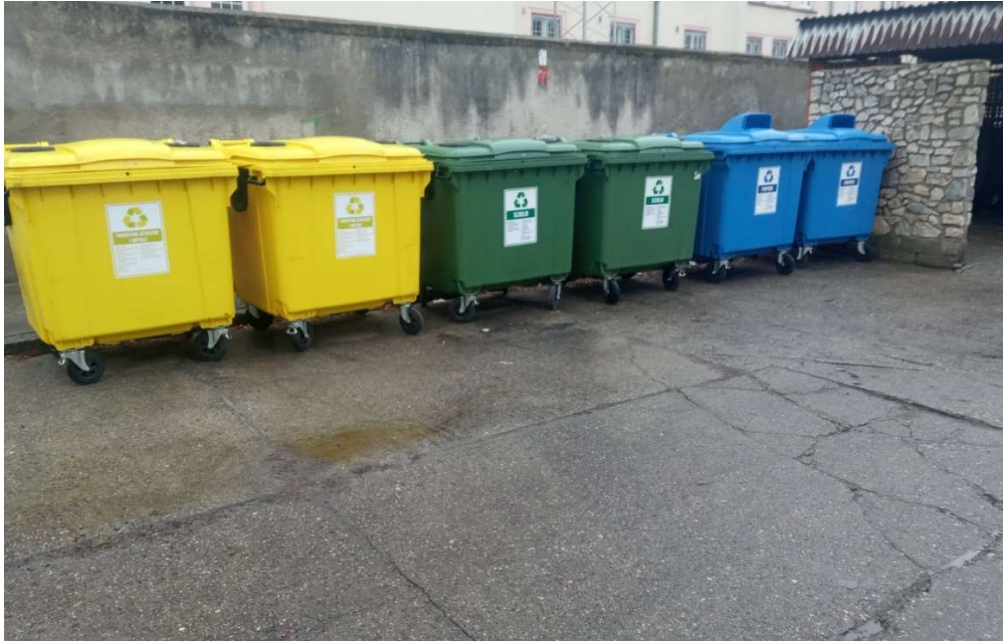
Zdjęcie 1: Nowe pojemniki do selektywnej zbiórki odpadów

W analizowanym roku w wyniku przeprowadzonego przetargu nieograniczonego odpady komunalne z terenu Raciborza odbierało Przedsiębiorstwo Komunalne Sp. z o.o. z Raciborza, z którym podpisana została umowa na okres od dnia 01.01.2022 r. do dnia 31.12.2024 r., zapewniająca niską cenę odbioru odpadów za każdą tonę.