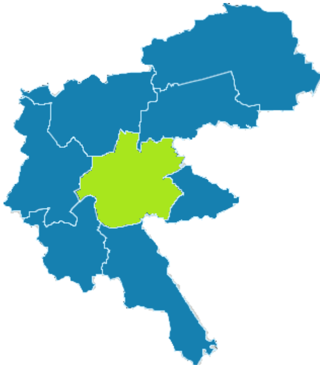
Rysunek 1 Położenie Gminy Racibórz na tle powiatu Raciborskiego